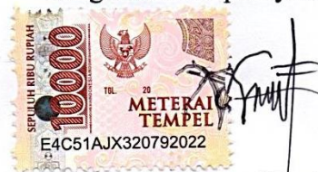
Atanasius Lume Keraf

Ende, Agustus 2021 Yang membuat pernyataan