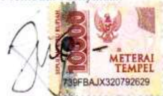
Lodovikus Doa Wu