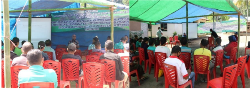
Gambar 1. Pemateri memberi penyuluhan bagi kelompok tani dan ternak.