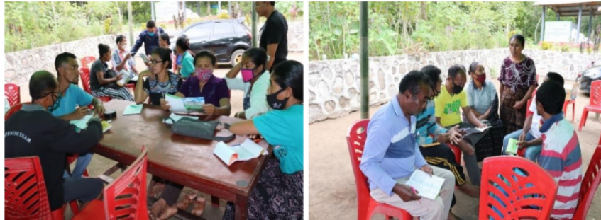
Gambar 2. Diskusi tentang AD/ART di kelompok tani Gambar 3. Diskusi tentang AD/ART di kelompok ternak

AD/ART kelompok tani dan ternak, 2 buku diberikan masing-masing ke kelompok tani dan ternak, 1 buku diberikan ke Desa Randotonda, dan 1 buku dokumen penyelenggara. Foto diskusi penyusunan AD/ART kelompok tani dan ternak pada gambar 2 dan Gambar 3.