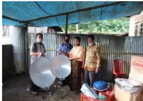
Gambar 3. Penyerahan Alat bagi Tim PKK

Pelatihan pengolahan ubikayu Nuabosi menjadi beberapa produk makanan turunan, diawali dengan menyerahkan alat-alat pengolahan kepala ketua dan anggota PKK yang dibeli oleh tim Universitas Flores, pendanaan dari Kemenristek-Brin Jakarta. Alat-alat tersebut meliputi: kompor, spiner (peniris minyak), alat pengiris ubi kayu, wajan, blender, mol, pisau, baskom, keranjang industri, pan lumpur, gunting, serbet, alat timbangan, plastik untuk kemasan, alat pengemasan produk, ember, gayung dan serokan. Penyerahan alat-alat tersebut pada Gambar 3.