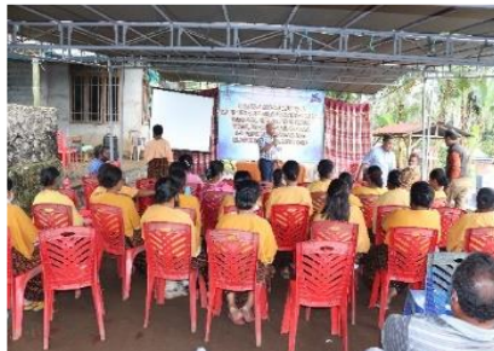
Gambar 2. Penyuluhan dan Pelatihan Kiat-Kiat Sukses Berwirausaha.

Kegiatan penyuluhan dan pelatihan Kiat-kiat sukses berwirausaha dilaksanakan pada tanggal 27 Mei 2021 dari jam 09.00 sd 17.00 di halaman Kantor Desa Randotonda Kecamatan Ende, diikuti oleh 30 orang anggota PKK. Kegiatan diawali dengan pretest bagi 30 orang anggota PKK. Pelaksanaan kegiatan ini berangkat dari permasalahan yang ditemukan pada mitra, (Akmalia & Hindasah, 2021), diharapkan setelah selesainya kegiatan ini terbentuknya wirausaha baru di desa. Peserta penyuluhan aktif mengikuti kegiatan, terlihat dari semua peserta hadir, bersama kepala desa, aparat desa dan tokoh-tokoh masyarakat. Peserta aktif bertanya dan menjawab pertanyaan. Inti dari kewirausahaan membuat sesuatu yang berbeda, sesuatu yang baru dan memberi nilai tambah bagi sasaran, (Sitanggang et al., 2020). Foto kegiatan penyuluhan dan pelatihan kiat-kiat sukses berwirausaha pada Gambar 2.