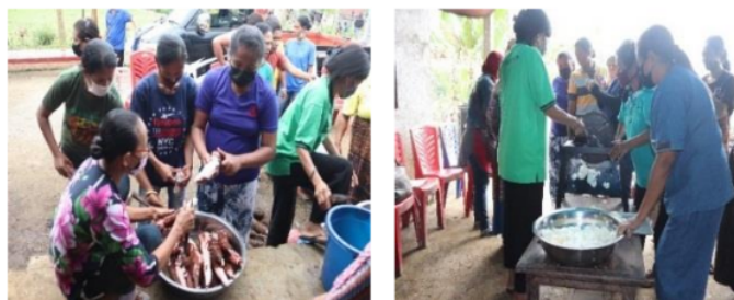
Gambar 4. Proses Produksi Kripik Singkong, Kremes dan Wingko

Setelah kegiatan penyortiran, dilakukan pembersihan ubikayu, dikupas kulitnya, dibersihkan, kemudian ketiga varietas tersebut dipisahkan pada masing-masing keranjang. Tahap selanjutnya ubikayu dipotong dengan mesin pemotong agar mendapat bentuk dan ketebalan yang sama, kemudian digoreng, ditiris menggunakan spiner untuk mengeringkan minyak agar mendapatkan kripik dengan kualitas yang lebih baik. Bumbu balado dibuat sendiri, untuk menghindari bahan pengawet. Bumbu yang sudah selesai diproses diolah bersama dengan kripik yang dtelah digoreng. Kemudian dibuat kemasan dan label yang sudah diberi merk produk dengan nama. "Qurena". Kegiatan tersebut di atas dilakukan pada tanggal 5 Juni, 8 Juni dan 10 Juni 2021. Merk produk berfungsi sebagai identitas produk, pengingat bagi komsumen, disamping dapat meningkatkan value produk. Hal ini sejalan dengan pemikiran Rini et al., (2020). Syahrir et al., (2015) dalam temuan penelitian menginformasikan bahwa konsumen bersedia melakukan pembelian atau pembelian ulang pada produk yang telah berlabel. Bahan dan bentuk kemasan berpengaruh signifikan terhadap minat beli konsumen Mufreni, (2016). Selesai pelatihan peserta diberi posttest dan dilakukan tanyajawab untuk mengukur sejauhmana tingkat pemahaman dan keterampilan setelah selesai pelatihan. Foto-foto kegiatan pengolahan ubikayu menjadi kripik, kremes dan wingko pada Gambar 4.