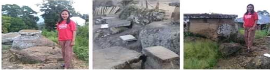
Foto. Kubur Batu Nuabari