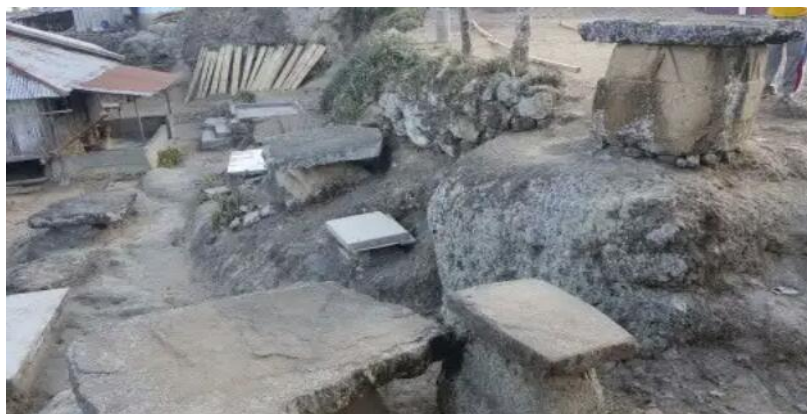
Foto. Kubur Batu Nuabari