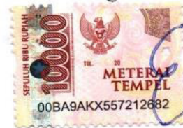
Eleonora Hendrika Kampo

Ende, 14 Agustus 2023 Yang membuat pernyataan