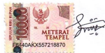
Sandroanus Lamba Randu