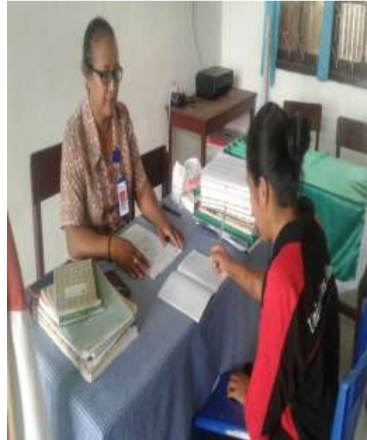
Dokumentasi wawancara dengan Kepala Sekolah pada hari Jumad, 13 November 2020