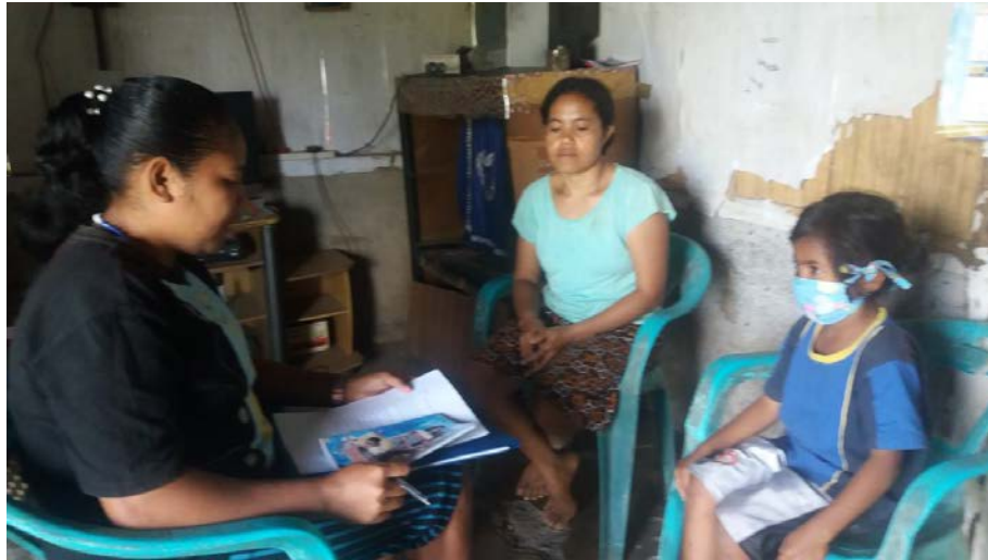
Gambar 3 Peneliti sedang mewawancarai salah satu orangtua