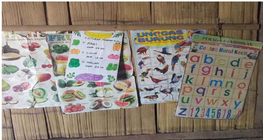
Gambar 2 Salah satu fasilitas membaca yang disiapkan orang tua