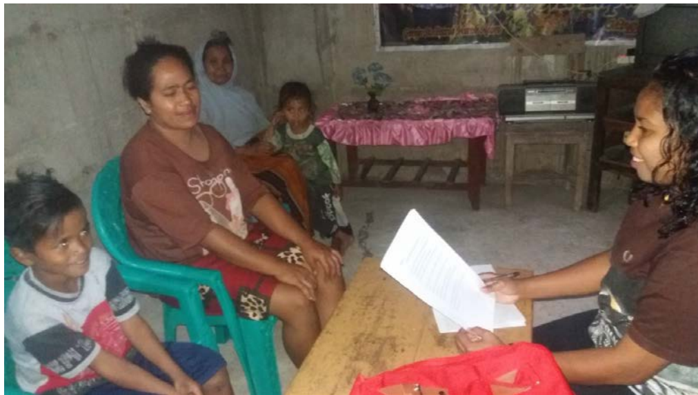
Gambar 4 Peneliti mewawancarai salah satu orangtua