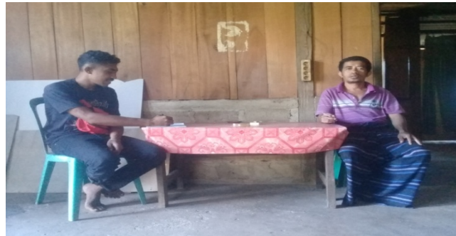
Gambar 1.1 Wawancara S1