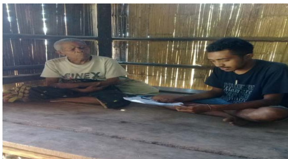
Gambar 1.2 Wawancara dengan S2