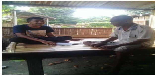
Gambar 1.3 Wawancara dengan S3