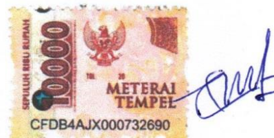
Afrisia Paskalia Tuku