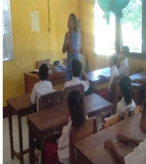
Kegiatan guru menjelaskan materi pembelajaran di depan kelas