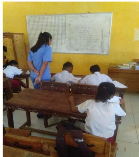
Kegiatan peserta didik saat mengerjakan tes evaluasi yang diberikan guru dan kegiatan guru mengawasi peserta didik saat mengerjakan tes evaluasi