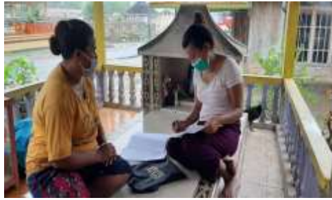
Gambar 4 Peneliti mewawancahi salah satu orangtua