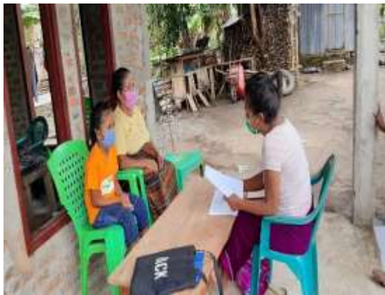
Gambar 5 peneliti mewawancarahi salah satu orang tua