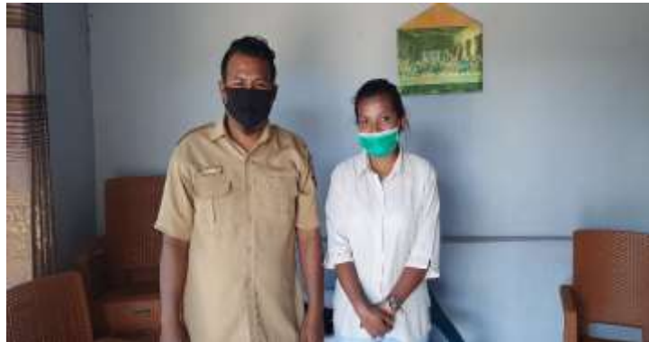
Gambar 1 peneliti dengan bapak kepala desa