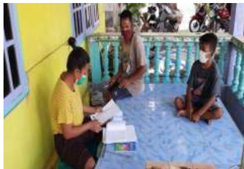
Gambar 3 Peneliti sedang mewawancarai salah satu orangtua