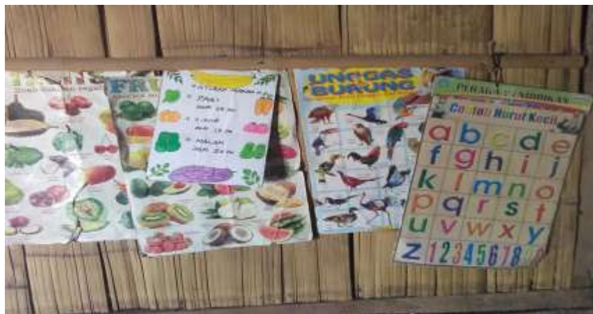
Gambar 2 Salah satu fasilitas belajar yang disiapkan orang tua