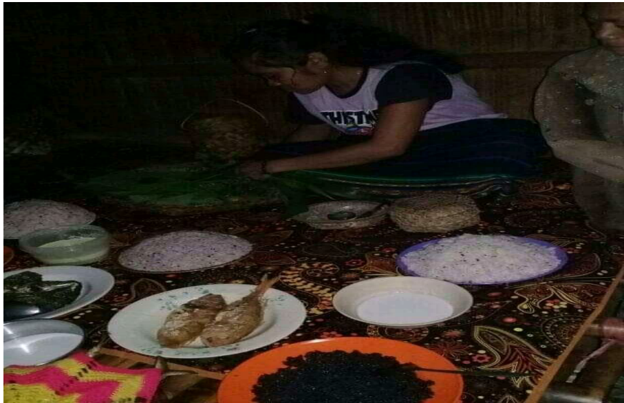
Gambar 1.6 Proses ritual Reka Wu'un sub suku Molan (Diambil tanggal 15 februari 2020)