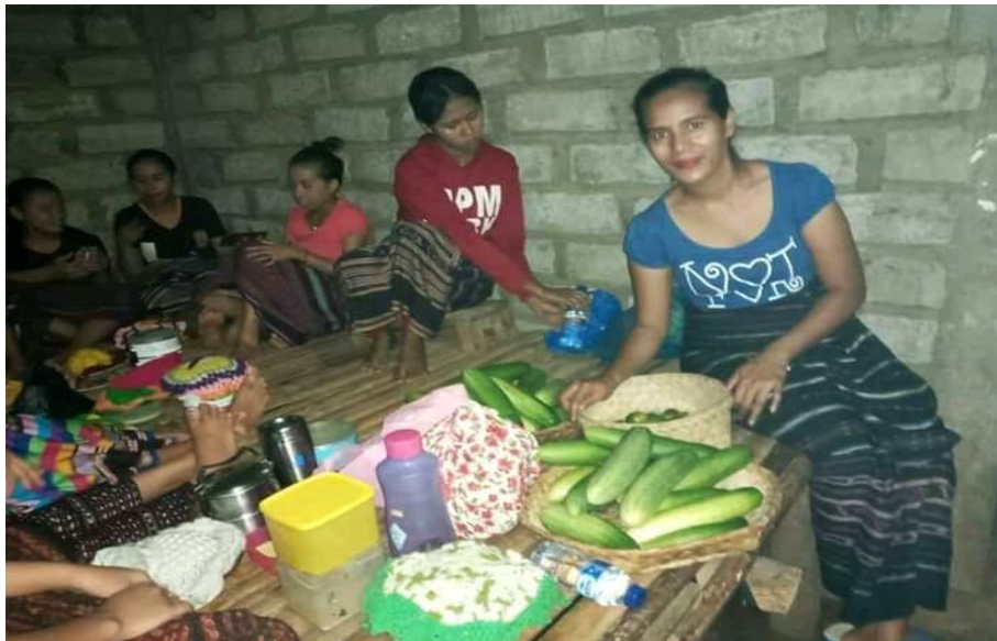
Gambar 1.7 Proses ritual Reka Wu'un sub suku Welan (Diambil tanggal 10 februari 2020)