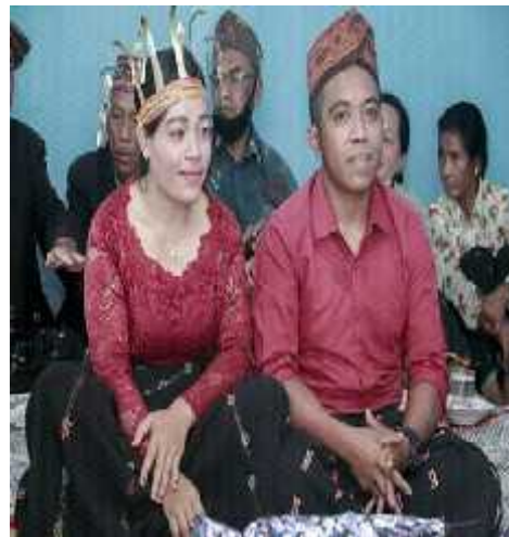
Perkawinan Tungku Cu Informan ( Umur: 28 dan 31 Tahun) Tanggal 4 September