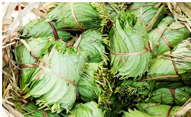
Dokumen Pribadi Sirih (Rebo) Siap untuk diundi dan disajikan untuk keluarga saat upacara Foto tanggal 7 september