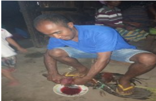
Dokumen Pribadi Penyembelitan Ayam yang sudah diupacarakan (pintu pazir) Foto tanggal 7 september