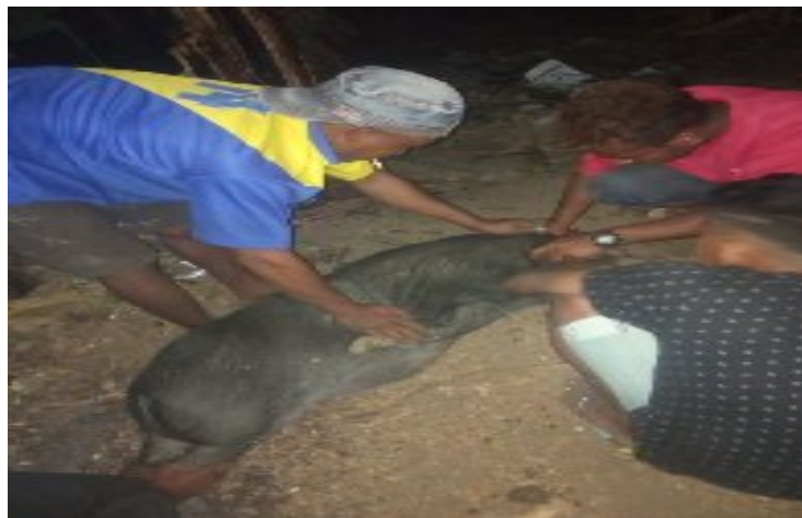
Dokumen Pribadi Persiapan penyembelian Babi Untuk upacara pemberian nama anak Foto tanggal 7 september