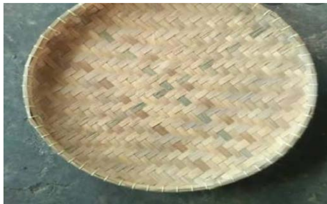
Dokumen Pribadi Nyiru (dining) digunakan untuk mengundi siri dan pinang serta menyimpan nasi foto tanggal 7 september