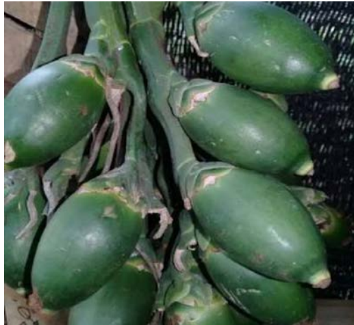
Dokumen Pribadi Buah pinang (W'ne) Siap untuk diundi dan disajikan untuk keluarga saat upacara Foto tanggal 7 september