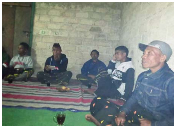
Dokumen Pribadi Keluarga yang hadir dalam upacara pemberian nama anak Foto Tanggal 7 September