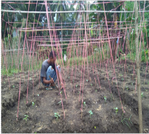
Perawatan Tanaman Kacang Panjang