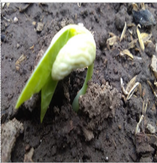
Tanaman Kacang Panjang Umur 7 Hst