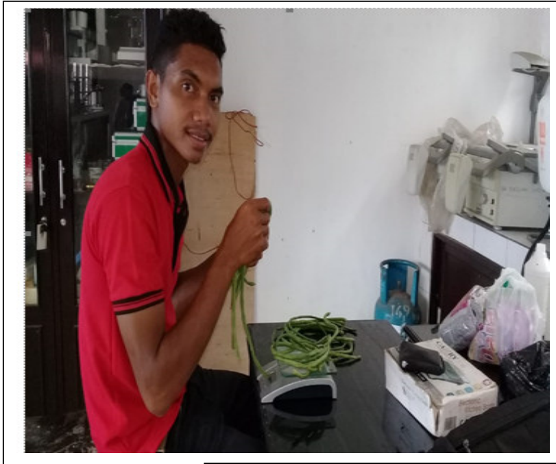
Pengamatan Berat Buah Tanaman Kacang Panjang