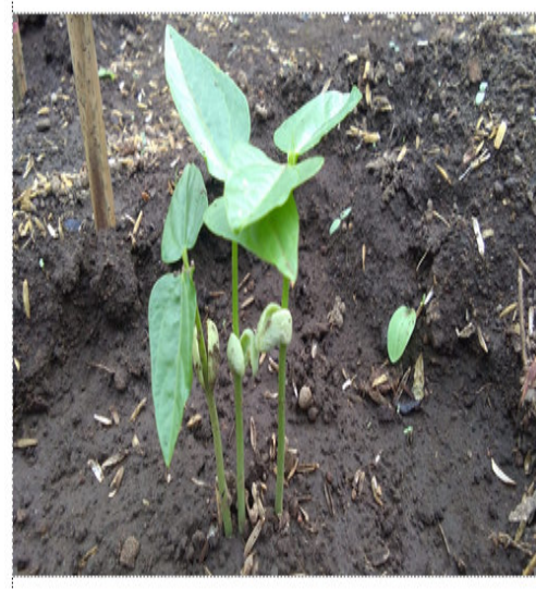
Tanaman Kacang Panjang Umur 14 Hst