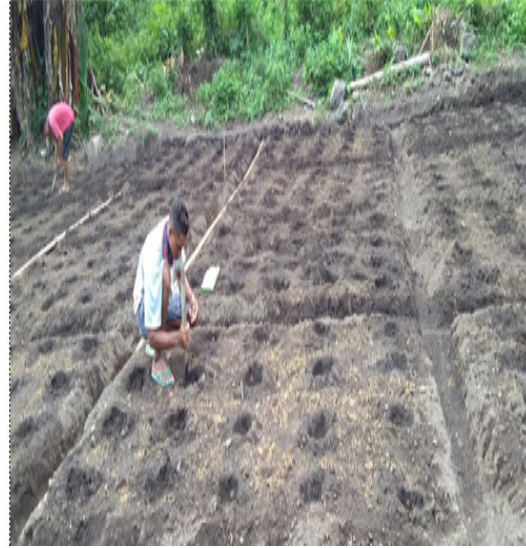
Dokumentasi Pembuatan Lubang Tanam dan Penanaman Kacang Panjang