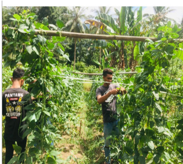
Panen Buah Tanaman Kacang Panjang