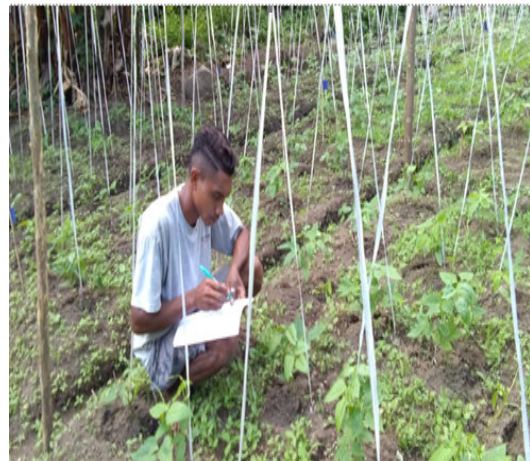
Pengamatan Pertumbuhan Tanaman Kacang Panjang