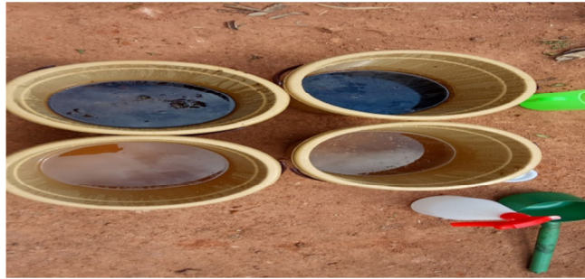
Gambar 2. Ekstrak Pestisida Nabati Kirinyuh, Sirsak, Lengkuas dan Sereh