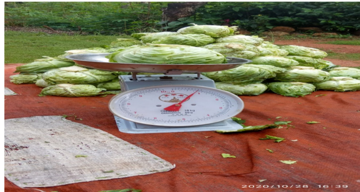
Gambar 5. Variable Hasil