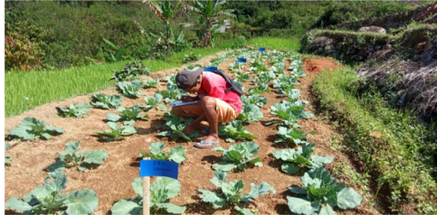
gambar 4. Identifikasi Ulat Plutella xylostella L.