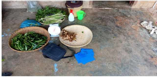
Gambar 1. Persiapan Alat dan Bahan