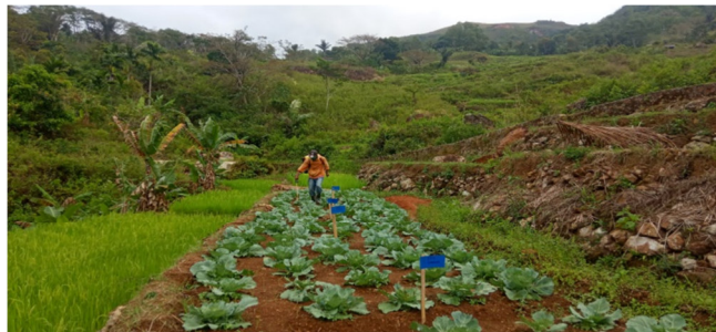
Gambar 3. Aplikasi Pestisida Nabati