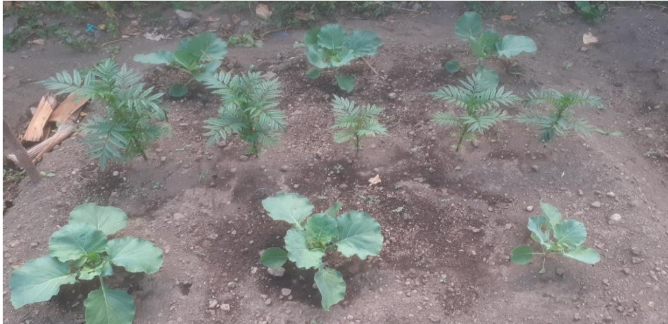
Tanaman kubis berumur 21 hst