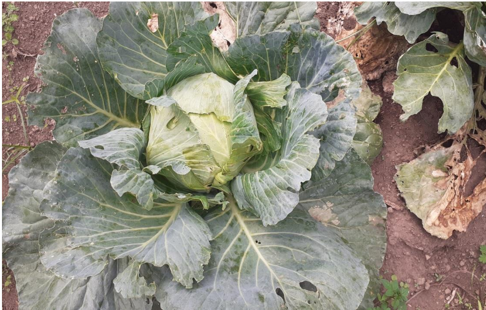
Tanaman kubis setelah 65 hst