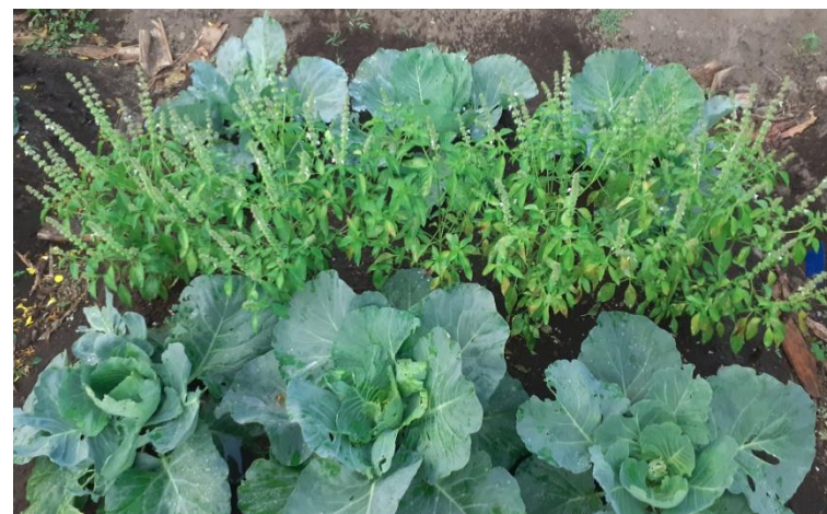
Tanaman kubis berumur 40 hst