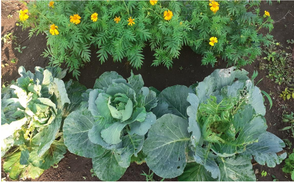
Tanaman kubis berumur 60 hst