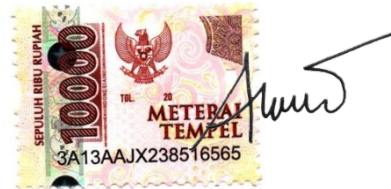
Filzah Farid Numba

Ende, Juli 2021 Yang membuat pernyataan,