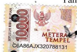
Yasinta Astuti Avila